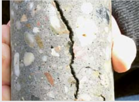
Deutlich erkennbarer Schaden: Der Riss erreicht die Hauptbewehrung.