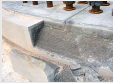
Die Natur hilft sich selbst: Unnützes wird, wie hier zu sehen, abgestoßen.