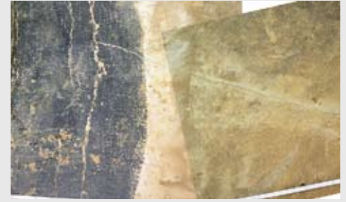
Umlaufende Rissbildung in Verbindung mit Radialrissen bei einem Kreuzbalkenfundament. Es könnte sich um eine unterschätzte Spannungskonzentration im Zwickel handeln.

die Übertragung der vertikalen Lasten als Druckkräfte in den Beton verantwortlich.