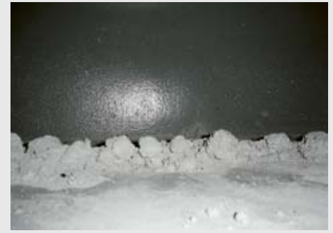
Umlaufende Rissbildung im WEA-Keller – mit Kalk-Blumen.

für eine Ermüdungsbelastung über 20 Jahre angenommen, das sind Schwingungen des Bauwerks mit einer Anzahl von 10^9 Lastwechseln (in Worten: eine Milliarde) das ist ca. 1,5 mal pro Sekunde.