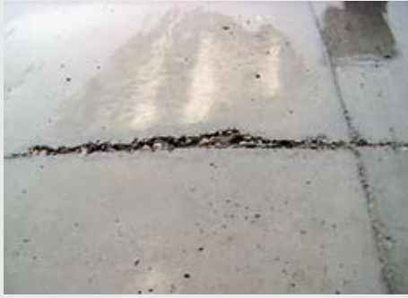
Eine schlecht ausgebildete Betonierfuge. Sie ist nicht nur unschön, sondern möglicherweise auch eine Zeitbombe.