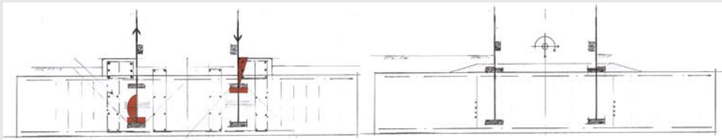
Das Turmeinbindekonzept – im Vergleich die mangelbehaftete Konstruktion.