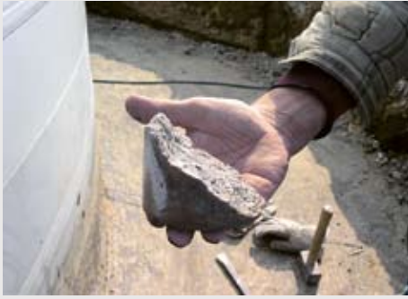
Kernbohrung: Nachweis des ringförmigen Ausbruchs einer unbewehrten Betonüberdeckung.